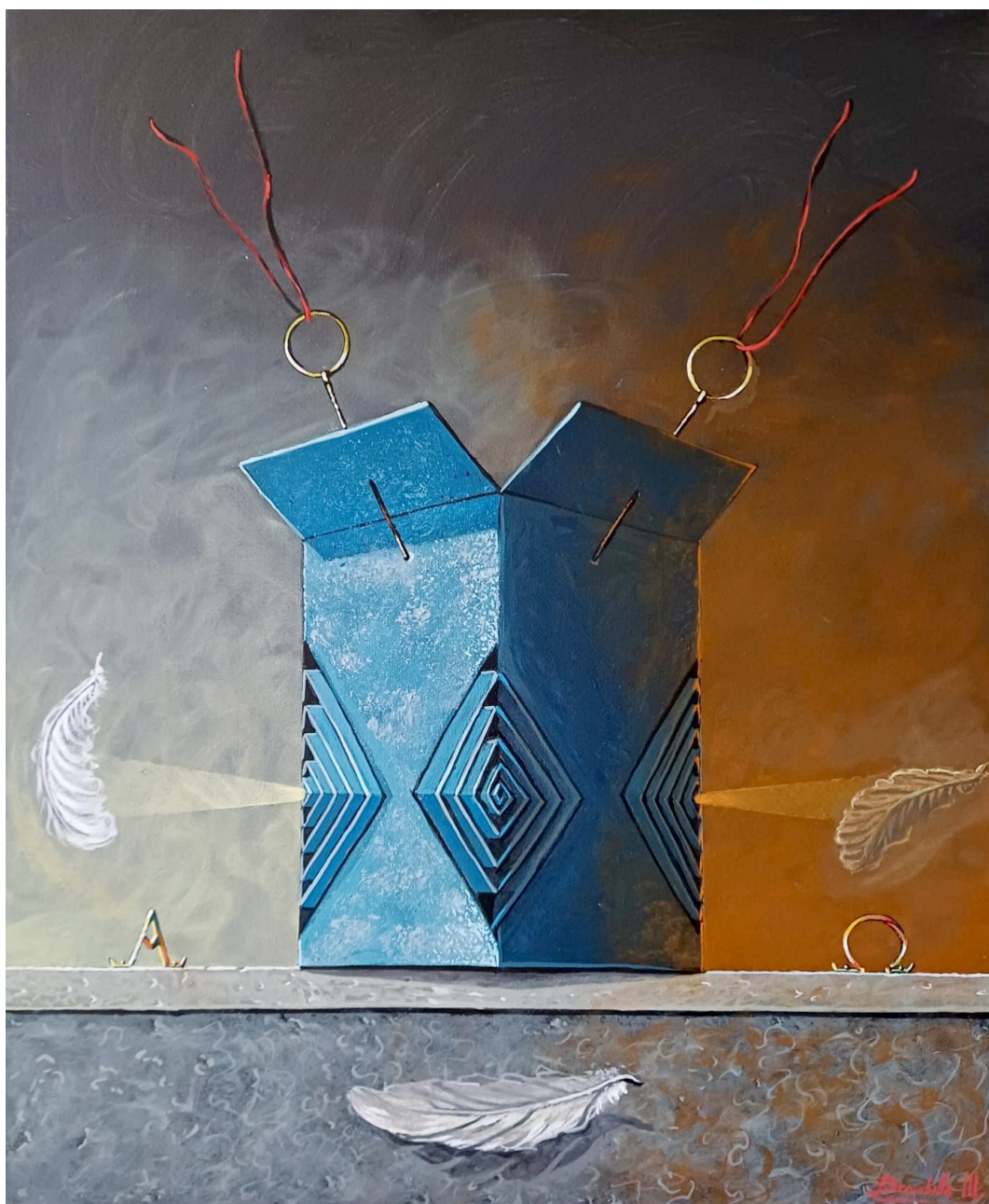
«Labirinto dell'anima», 2024

La sua pittura è caratterizzata da una luce delicata e sospesa, che avvolge gli elementi con discrezione, amplificando la sensazione di mistero. Oggetti comuni, figure silenziose e