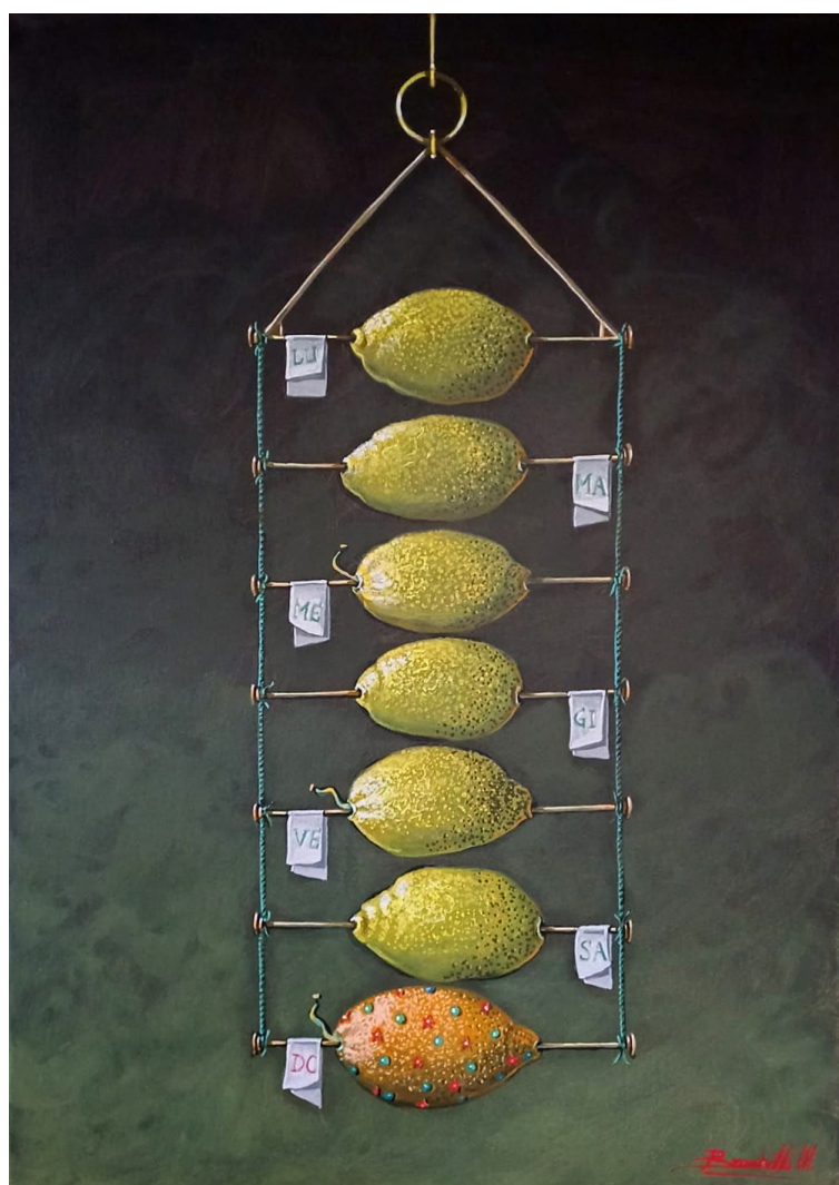
«La settimana dei limoni», 2025, cm 70x50